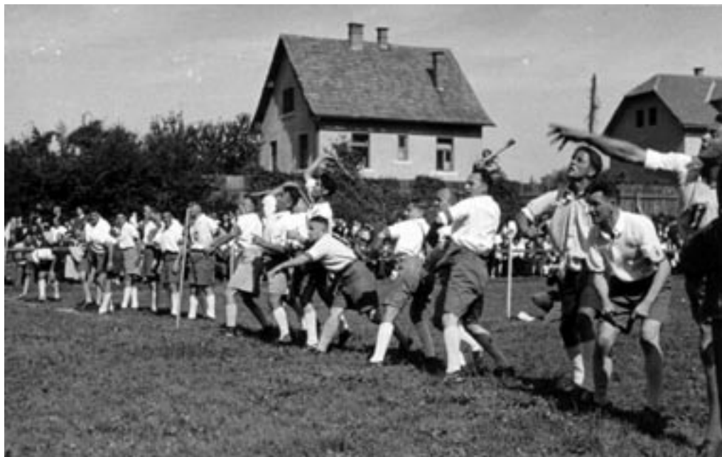
PRVI JAVNI NASTOP VERMANOV V CELJU, 3. 8. 1941.