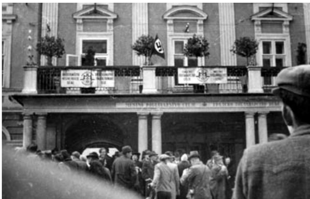
KLJUKASTI KRIŽ NA BALKONU MAGISTRATA, II. 4. 1941. (OTOREPEC, MNZC)