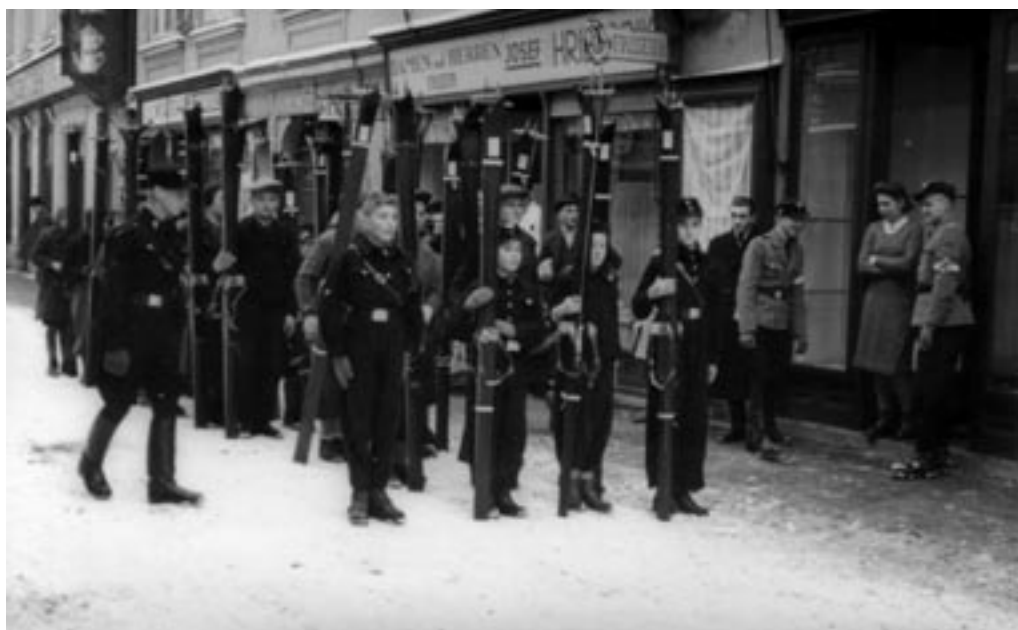
NEMŠKA MLADINA ZBIRA SMUČI ZA VOJAKE NA FRONTI, 9. I. 1942.