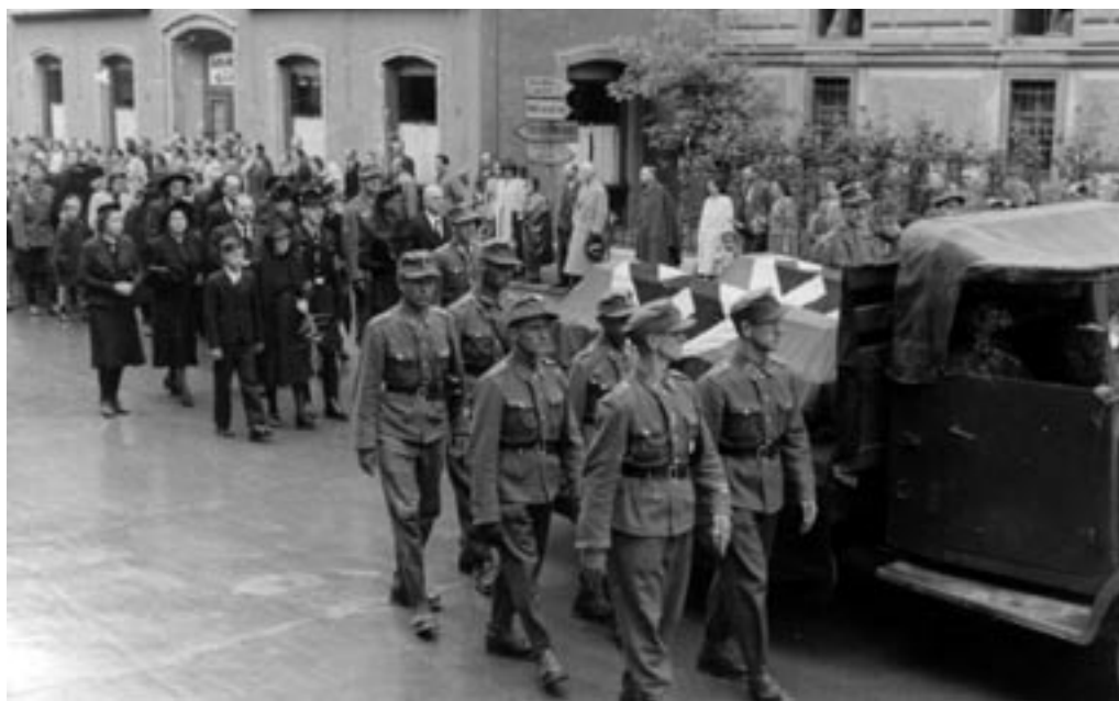
POGREBNI SPREVOD ZA PADLIMI VERMANI, 20. 6. 1942.