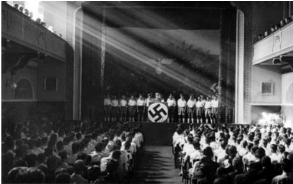
JUTRANJA SVEČANOST (MORGENFEIER) NEMŠKE MLADINE, 1941. (PELIKAN, MNZC)