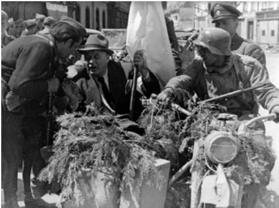
CELJSKI LEKARNAR POSAVEC SE POGAJA Z USTAŠI IN NEMCI, MAJ 1945. (PELIKAN, MNZC)