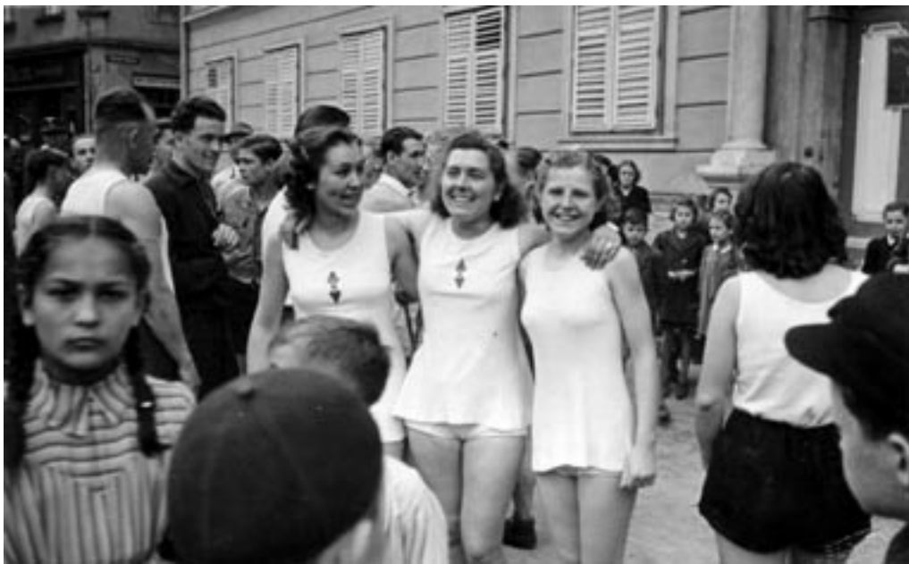
ŠTAFETNI TEK PO CELJSKIH ULICAH, 15. 3. 1942.