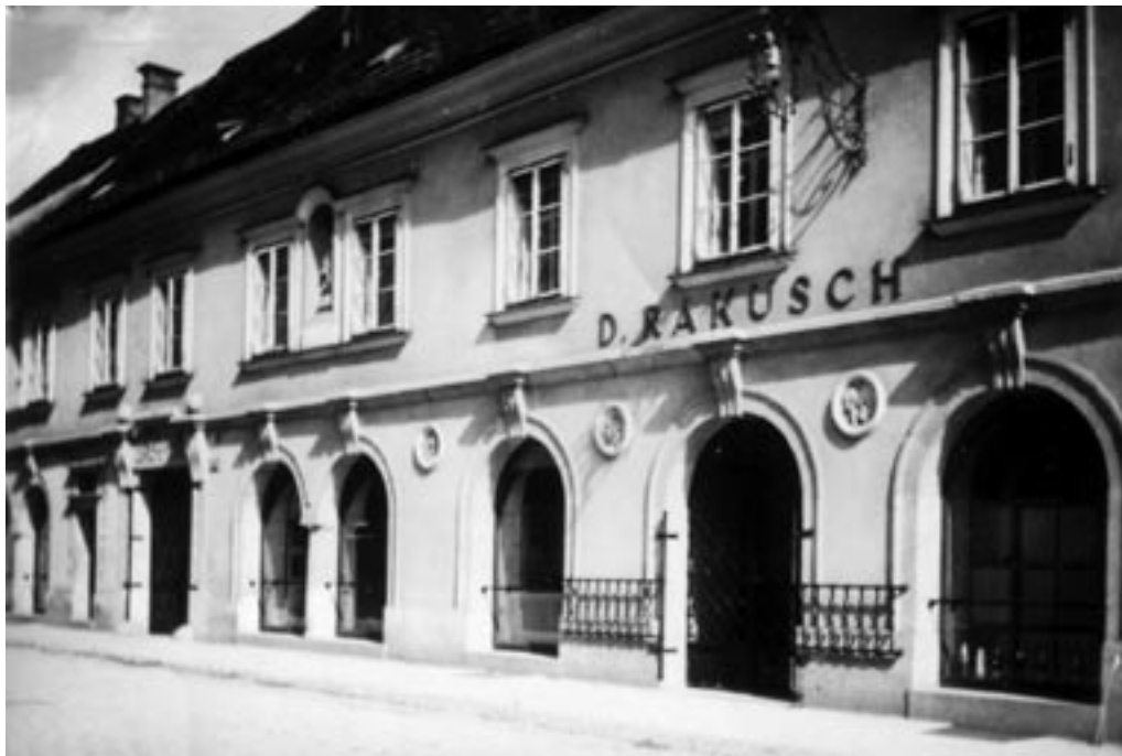
RAKUSCHEVA VELETRGOVINA Z ŽELEZNINO. (OKC)