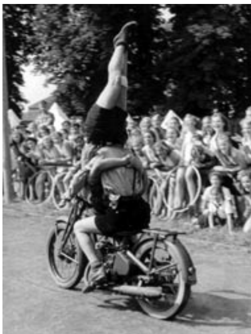
POLETNE IGRE NEMŠKE MLADINE, 25.-27. 6. 1943.

»Noch nie waren wir so jung, stark, gläubig und fanatisch, wie wir es heute sind!«