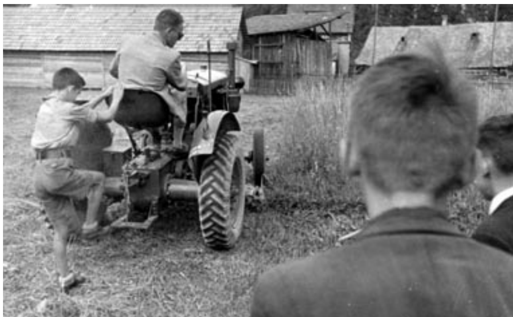
PRIKAZ UPORABE TRAKTORJEV V OKVIRU KMETIJSKE RAZSTAVE, 28. 6. 1942.