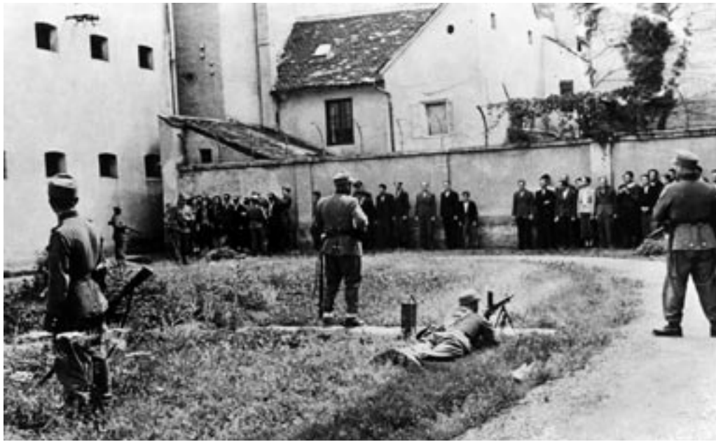
STRELJANJE TALCEV, 22. 7. 1942.