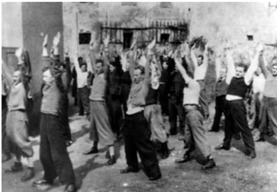
ZAPORNIKI V KAPUCINSKEM SAMOSTANU MED PRISILNO TELOVADBO, 1941. (MNZC)