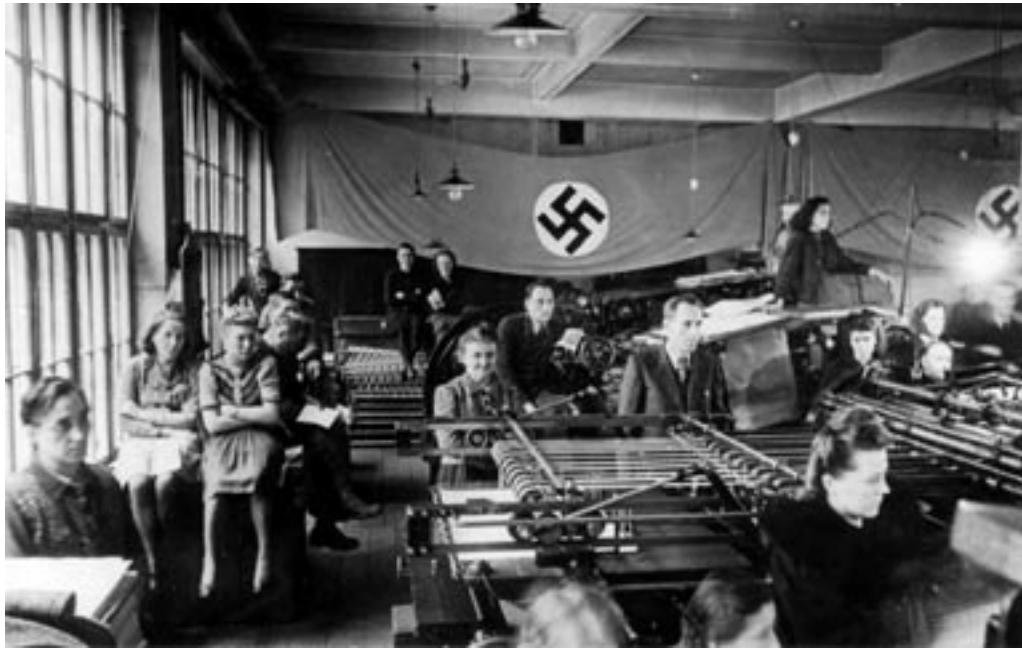
POLITIČNO ZBOROVANJE V CELJSKI (NEKDAJ MOHORJEVI) TISKARNI. (PELIKAN, MNZC)