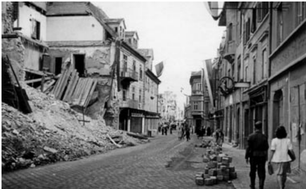
POSLEDICE ZAVEZNIŠKEGA BOMBARDIRANJA, 1944-45.