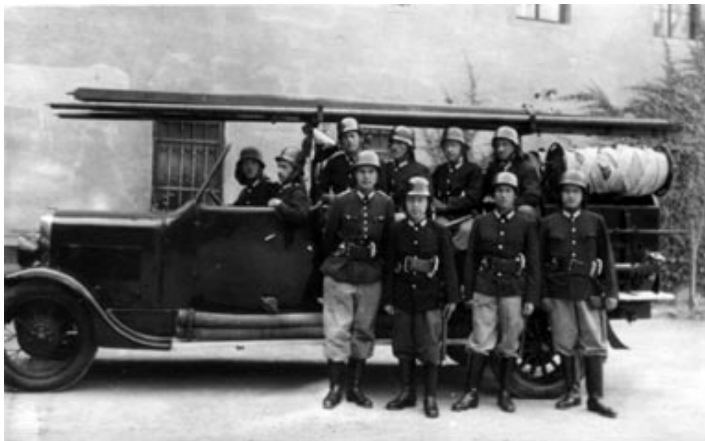
CELJSKI GASILCI, 1942. (PERŠAK, OKC)