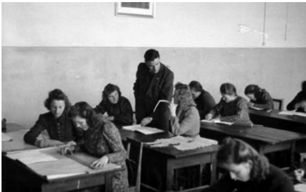
POUK LEPOPISJA IN KROJENJA NA VAJENIŠKI ŠOLI, 1941.