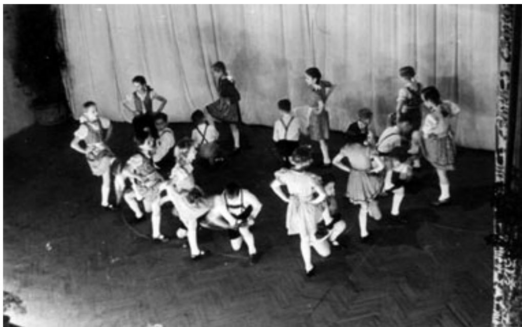
STARŠEVSKI VEČER, 1942. (PELIKAN, MNZC)