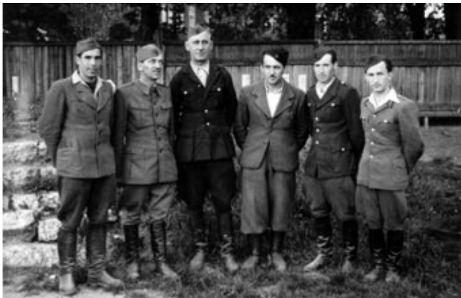
OSVODITELJI ZAPORNIKOV (DECEMBRA 1944) IZ STAREGA PISKRA, MAJ 1945. (MNZC)