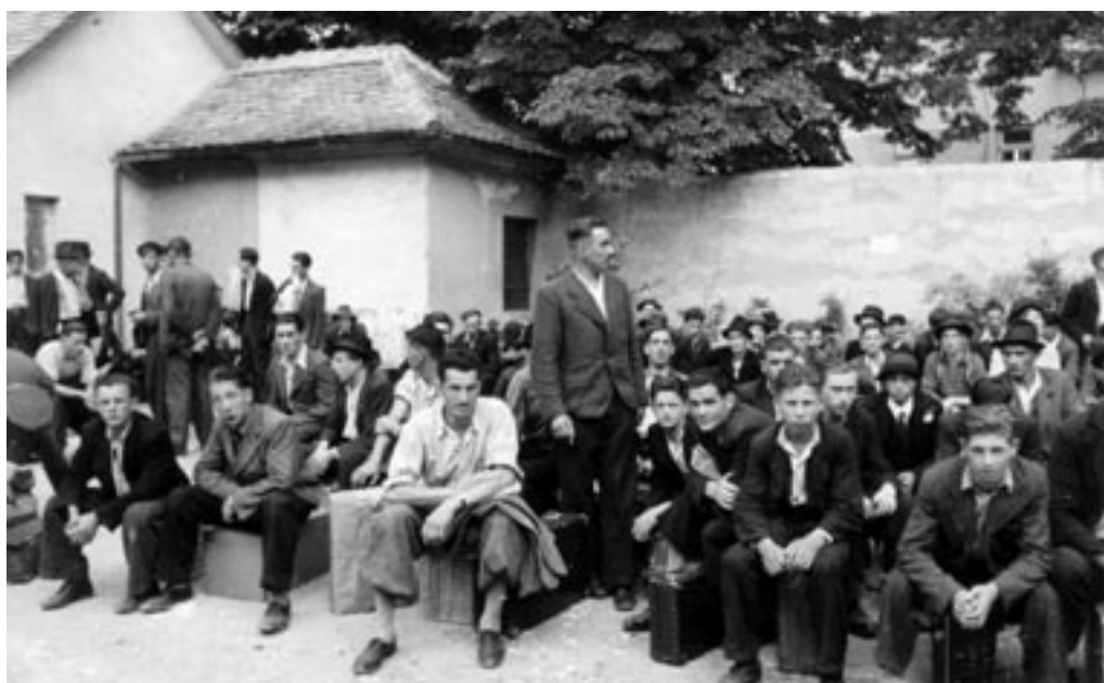
ODHOD MOŠKIH V DRŽAVNO DELOVNO SLUŽBO IN NEMŠKO VOJSKO, 23. 7. 1942.