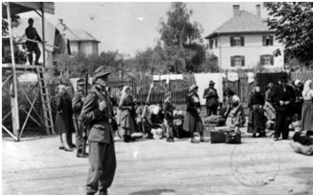
MATERE Z OTROKI PRED ŠOLO, AVGUST 1942. (PELIKAN, MNZC)