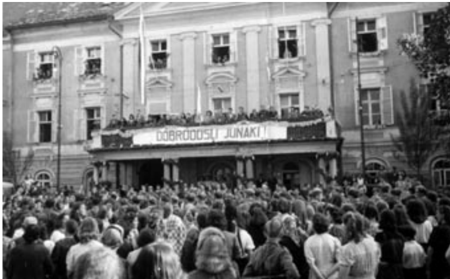
CELJE JE SVOBODNO- PRAZNOVANJE PRED MAGISTRATOM, 13. 5. 1945.