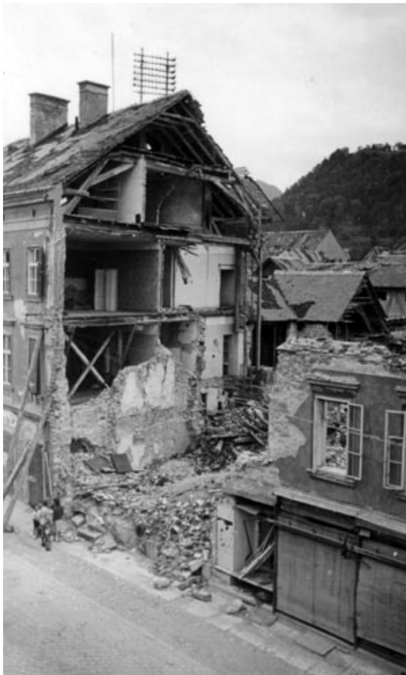
POSLEDICE ZAVEZNIŠKEGA BOMBARDIRANJA, 1944-45. (PELIKAN, MNZC)