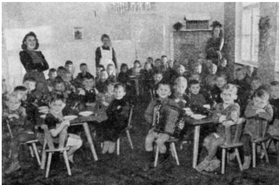
OTROŠKI VRTEC, 1943. (PERISSICH, UNTERSTEIRISCHER KALENDER 1943)