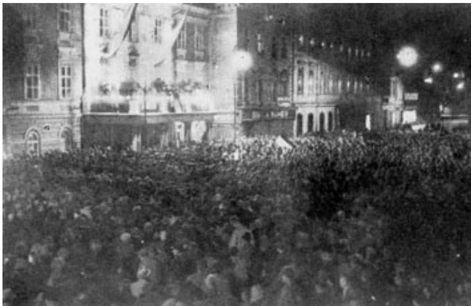
PROTESTNO ZBOROVANJE PROTI SODELOVANJU V TROJNEM PAKTU PRED CELJSKIM MAGISTRATOM, 27.3. 1941.