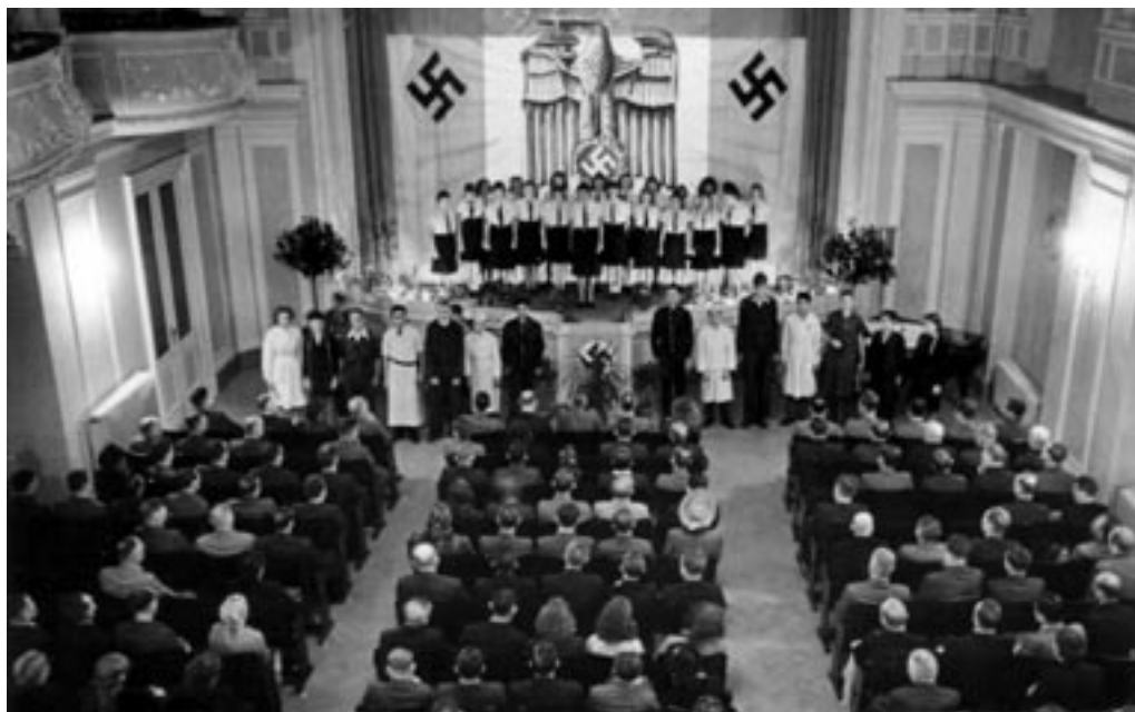
PODELITEV DIPLOM VAJENCEM, JESEN 1943.