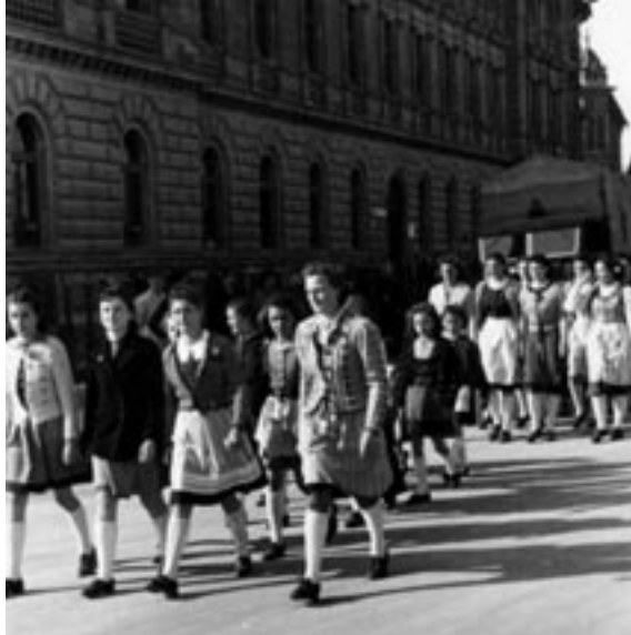
NEMŠKA DEKLETA, 1941.