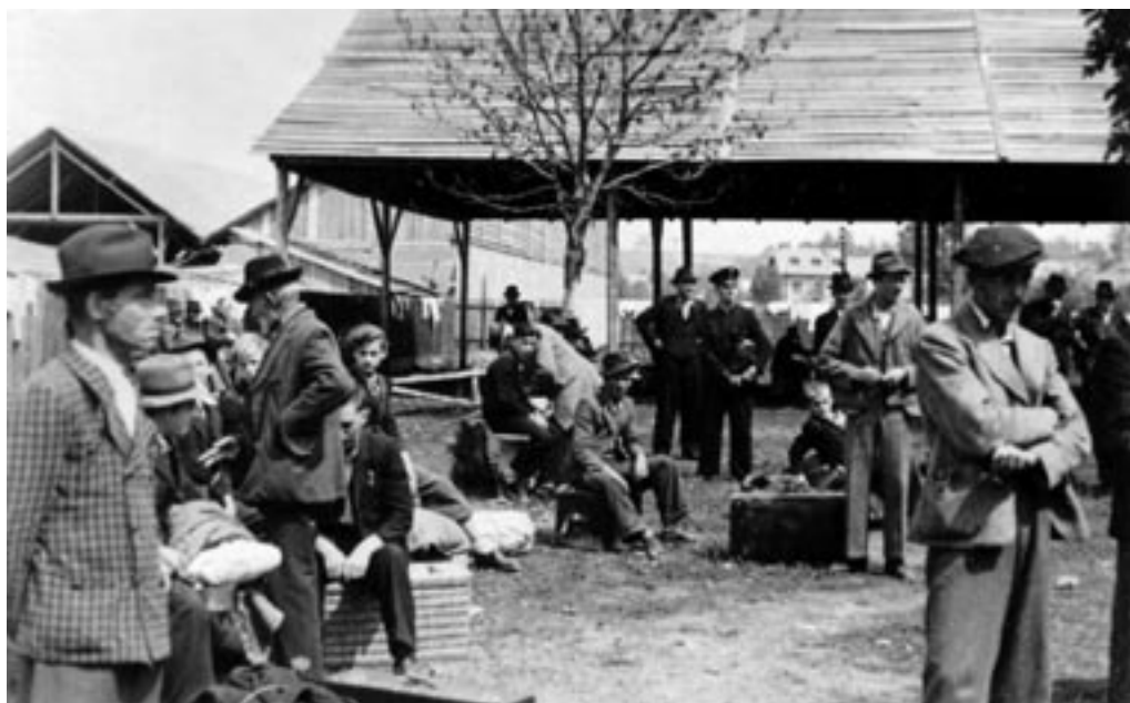
OČETJE NA ŠOLSKEM DVORIŠČU, AVGUST 1942.