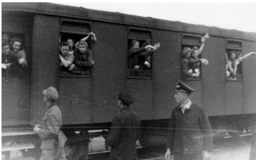
ODHOD ŽENA V DRŽAVNO DELOVNO SLUŽBO, 1942. (PELIKAN, MNZC)