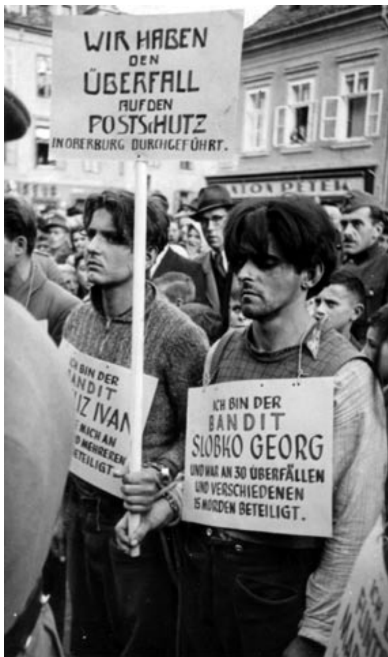
ZASRAMOVANJE UJETIH IN MRTVIH PARTIZANOV V CELJU, KOT »KAZEN« ZA ŠTEVILNE NAPADE NA OKUPATORSKO CIVILNO IN VOJAŠKO UPRAVO, NOVEMBER 1942. (MNZC)