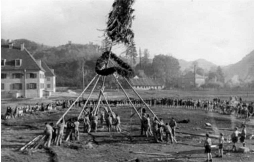
POSTAVLJANJE MLAJA NA ZELEDEM TRAVNIKU OB VOGLAJNI, I. 5. 1942.