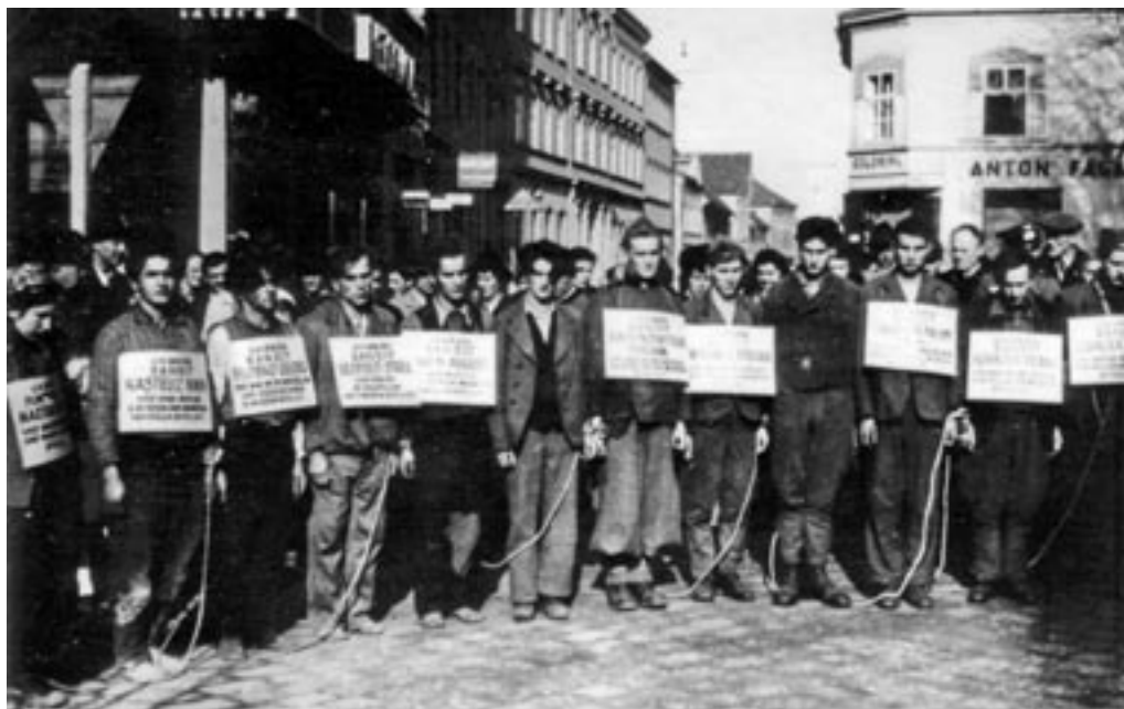
SRAMOTILNI SPREVED PO CELJSKIH ULICAH, NOVEMBER 1942. (MNZC)