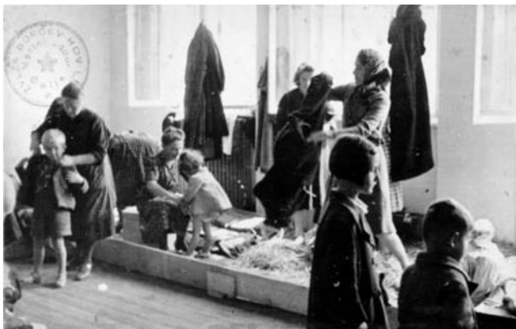
LOČITEV MATER OD OTROK, AVGUST 1942. (PELIKAN, MNZC)