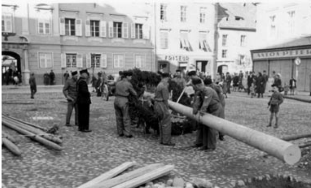
POSTAVLJANJE MLAJA PRED PROTHASIJEVIM DVORCEM IN NARODNIM DOMOM, I. 5. 1942. (PELIKAN, MNZC)