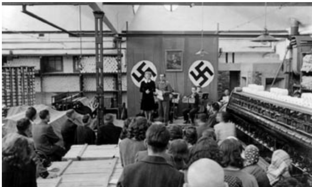
POLITIČNO ZBOROVANJE V CELJSKI TKALNICI.