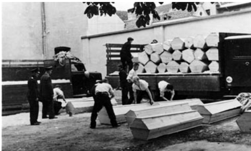
STRELJANJE TALCEV, 22. 7. 1942.