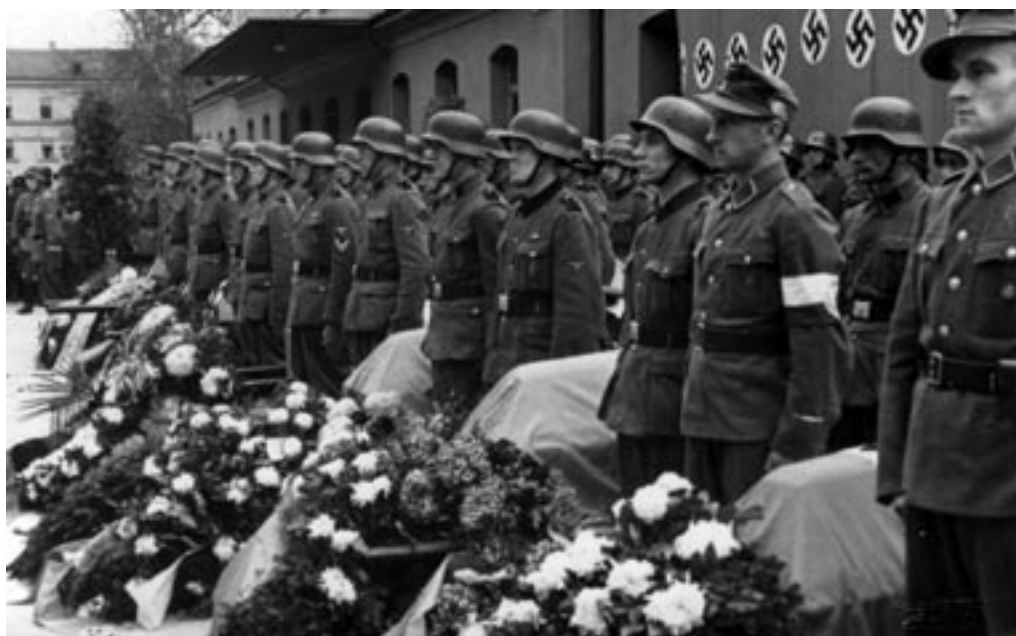
POGREB PRIPADNIKOV NEMŠKE POŠTNE OBRAMBE, PADLIH V BOJU S PARTIZANI, 7. II. 1942.