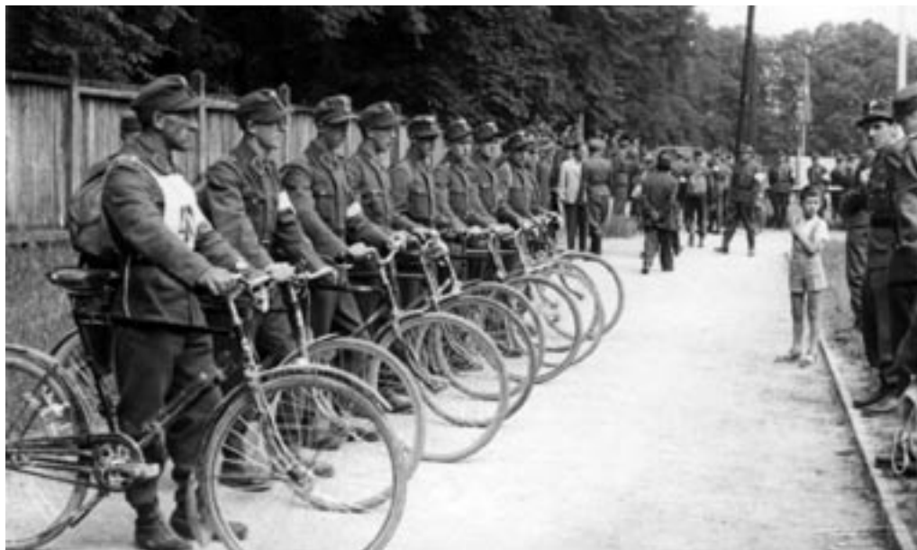
PRED TEKMOVANJEM VERMANSKIH KOLESARSKIH PATRULJ NA OKROŽNEM DNEVU, 29., 30. 8. 1942.