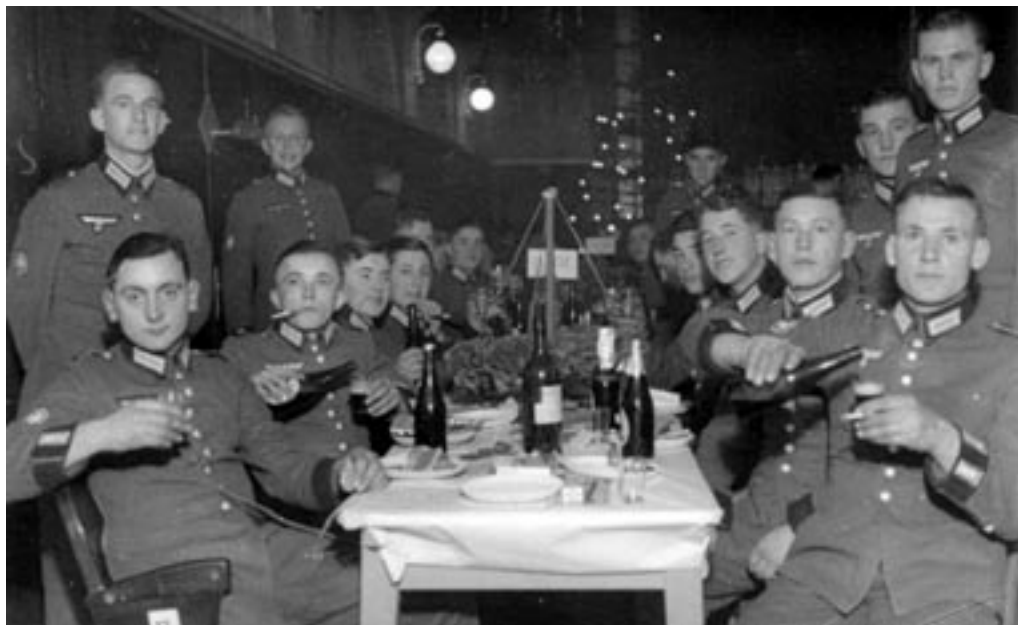
NEMŠKI VOJAKI PRAZNUJEJO V CELJU BOŽIČ, 1941. (PELIKAN, MNZC)