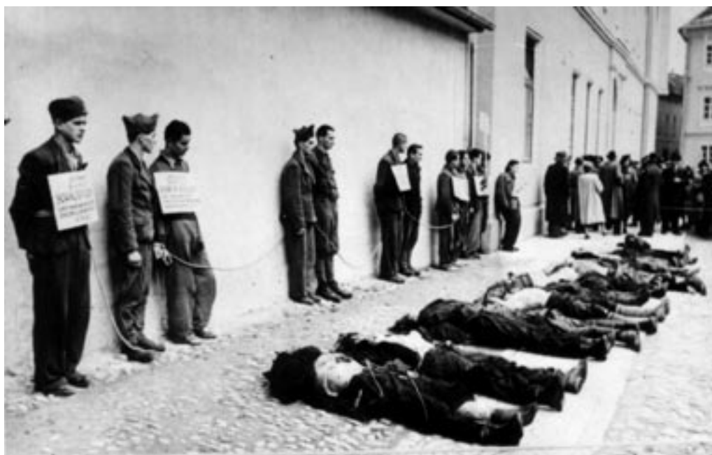
ZASRAMOVANJE UJETIH IN MRTVIH PARTIZANOV V CELJU, NOVEMBER 1942. (MNZC)