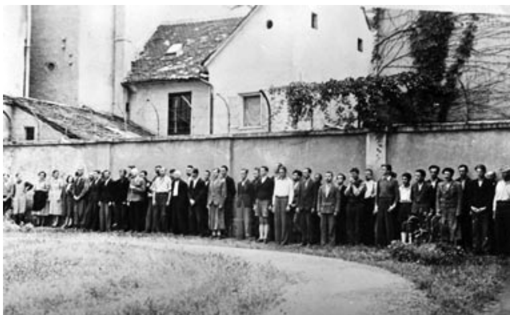
STRELJANJE TALCEV, 22. 7. 1942.