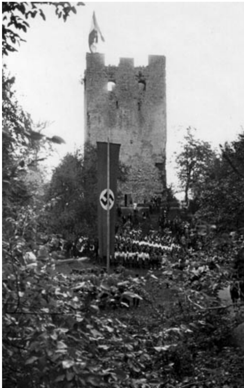
JUTRANJA SVEČANOST NA STAREM GRADU V OKVIRU OKROŽNEGA DNE, 29., 30. 8. 1942.