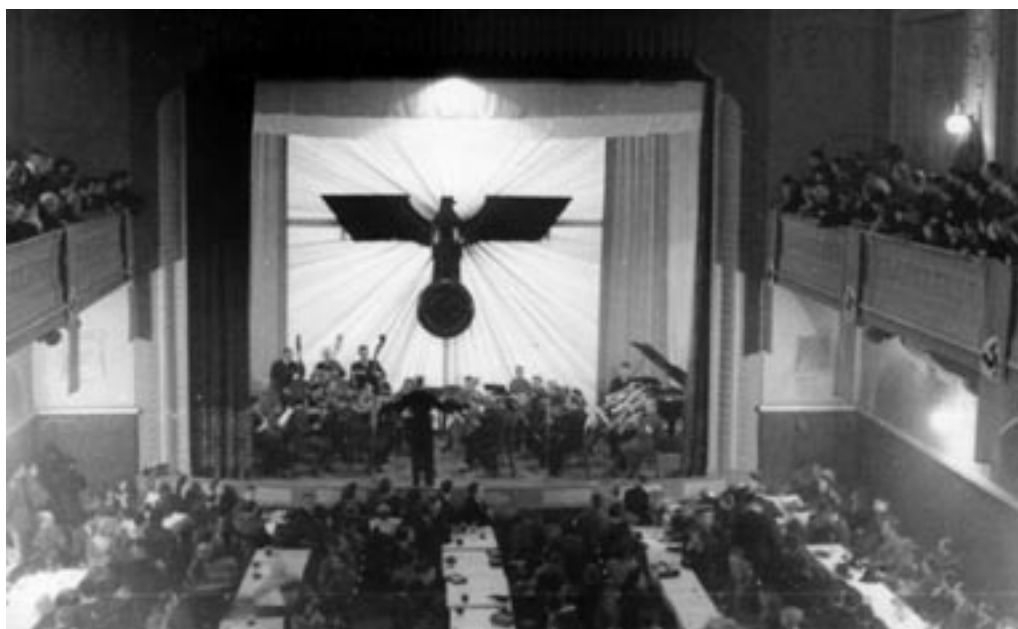
KONCERT V OKVIRU »ZIMSKE POMOČI«, 31. I. 1942.