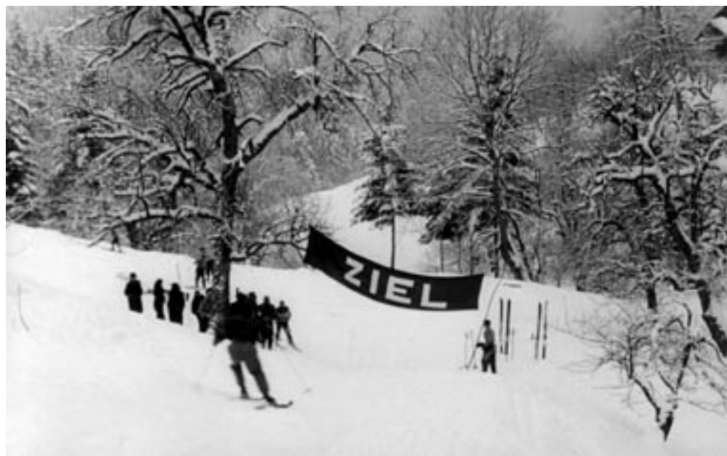
SMUČARSKO TEKMOVANJE NEMŠKE MLADINE, 22. I. 1942.