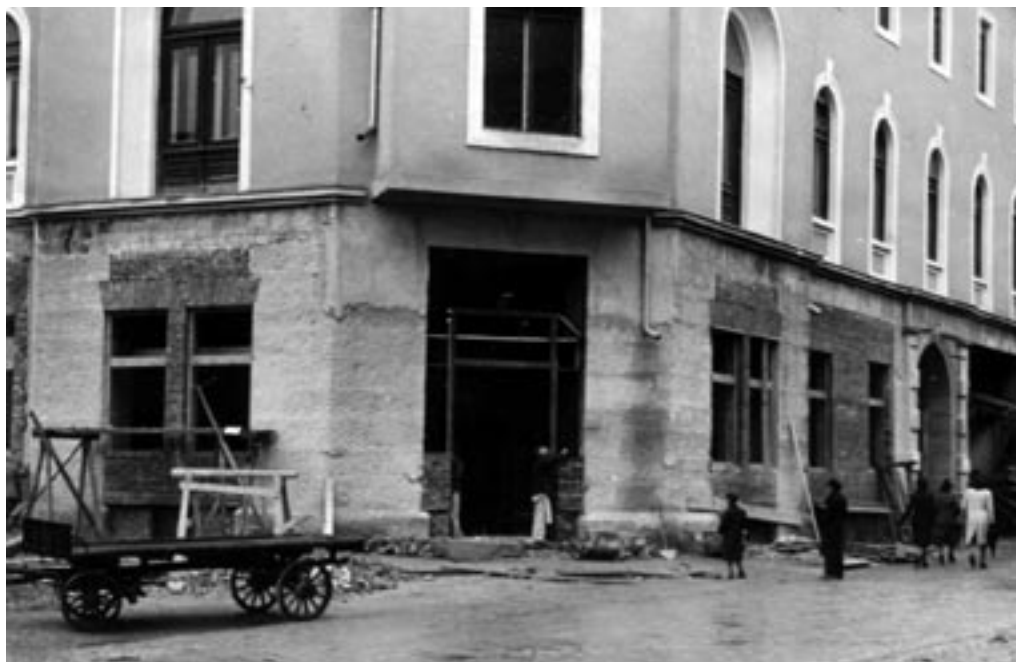
PREUREJANJE ZUNANJOSTI NARODNEGA DOMA ZA POTREBE OKUPATORSKE UPRAVE, 1941.