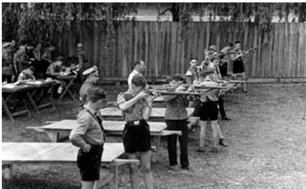
MED POLIGONOM IN STRELIŠČEM, POLETNE IGRE NEMŠKE MLADINE, 25.-27. 6. 1943.