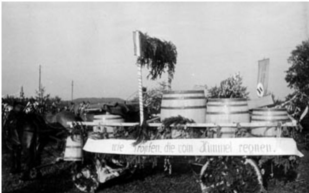
ŽETVENA SVEČANOST (ERNTEFEST) Z RAZSTAVO PRIDELKOV, JESEN 1943. (PELIKAN, MNZC)