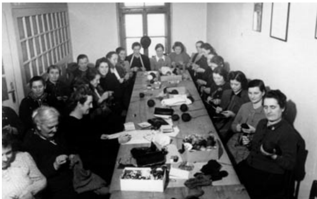
IZDELOVANJE OBLAČIL IZ KRZNA IN VOLNE ZA »ZIMSKO POMOČ«, ZIMA 41-42.