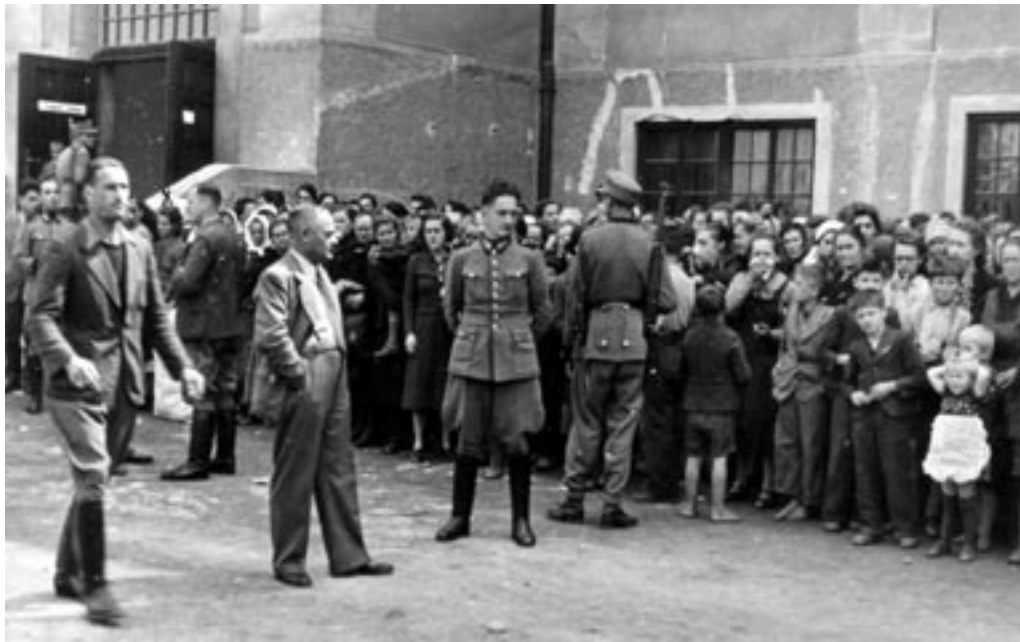
MATERE Z OTROKI PRED ŠOLO, AVGUST 1942.