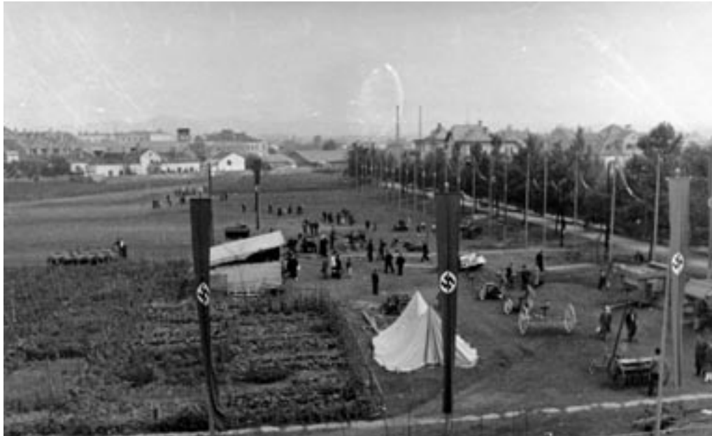
KMETIJSKA RAZSTAVA, 28. 6. 1942.