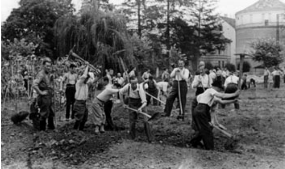
KOPANJE OBRAMBNIH JARKOV, 1945.