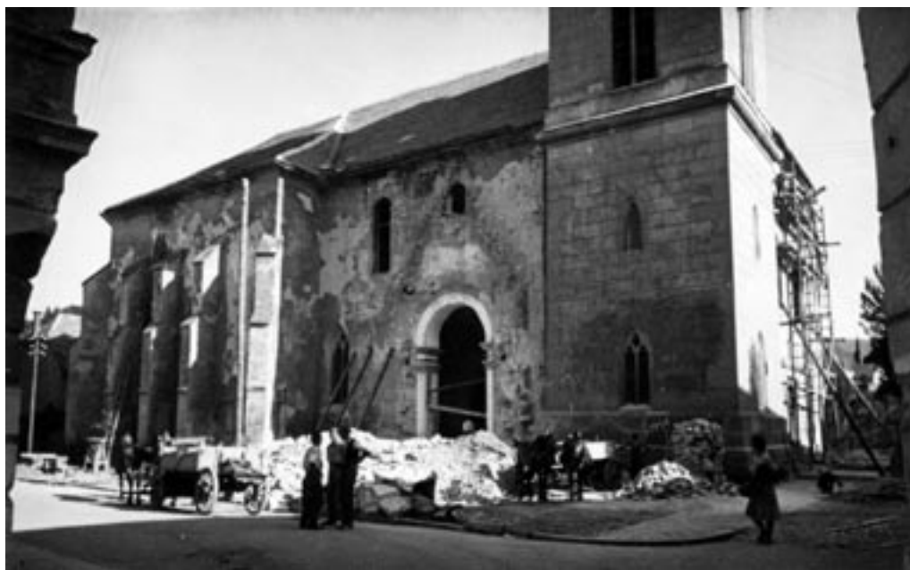
POSLEDICE ZAVEZNIŠKEGA BOMBARDIRANJA, 1944-45. (PELIKAN, MNZC)