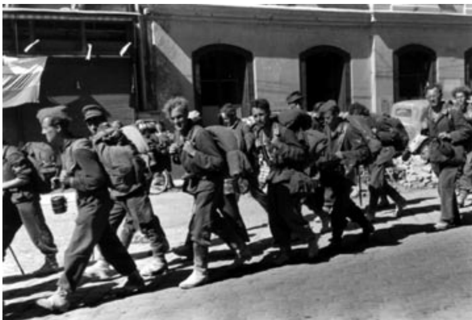
KOLONE NEMŠKIH UJETNIKOV, 12. 5. 1945.