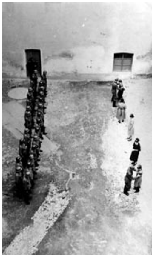
STRELJANJE TALCEV, 22. 7. 1942.

Nasilje, ki ga je nemški okupator izvajal nad prebivalstvom na področju Celja, predstavlja sestavni del raznarodovalnih načrtov in brutalnega zatiranja uporniškega in osvobodilnega gibanja, ki so od vsega začetka spremljali nacistično in fašistično okupacijo Slovenije.