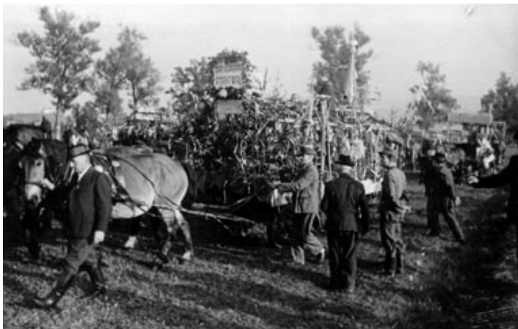
KMEČKA POVORKA V OKVIRU ŽETVENE SVEČANOSTI, JESEN 1943.