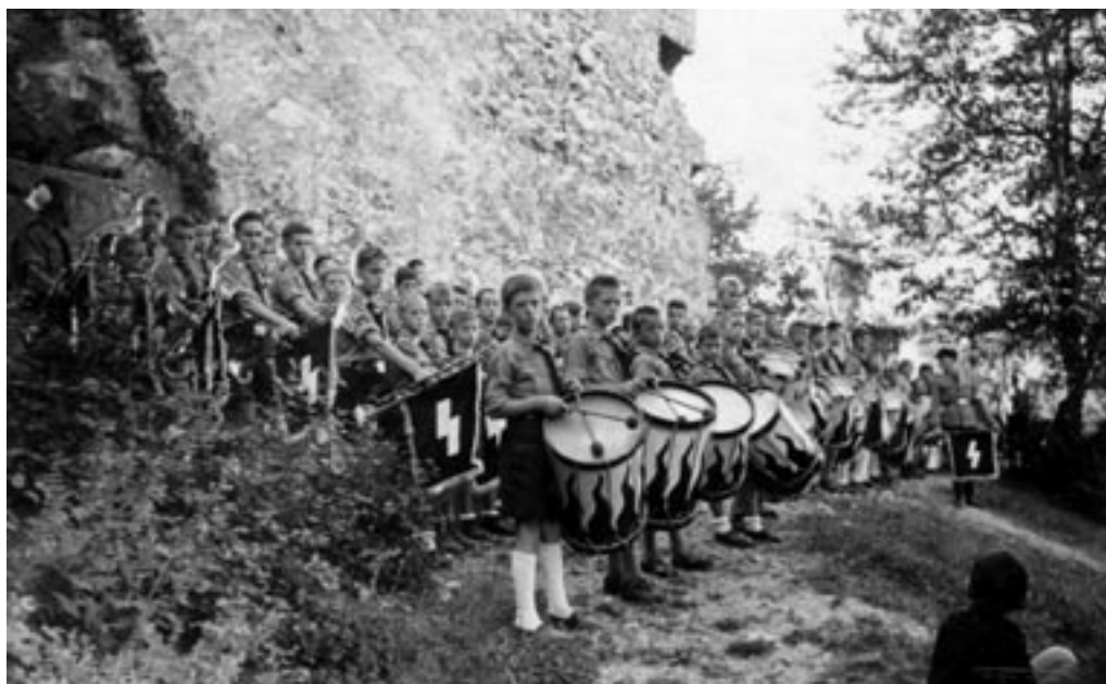
NASTOP BOBNARJEV IN FANFAR NEMŠKE MLADINE NA OKROŽNEM DNEVU, 29., 30. 8. 1942.