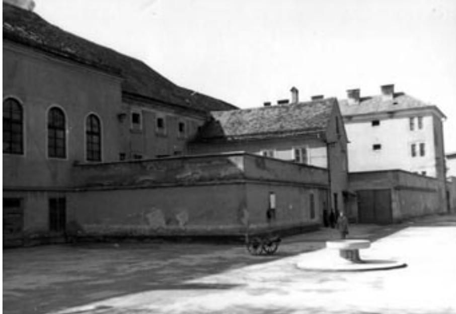
CELJSKI ZAPOR OZ. »STARI PISKER«. (MNZC)