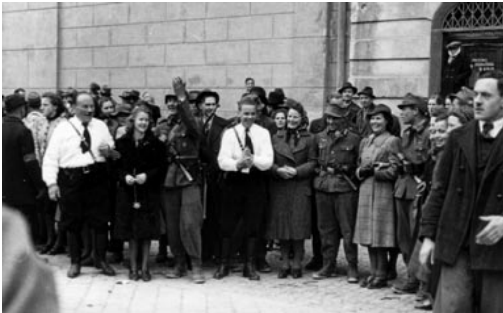
PRIHOD IN »SPONTANI« SPREJEM NEMŠKE VOJSKE, II. 4. 1941. (PELIKAN, MNZC)