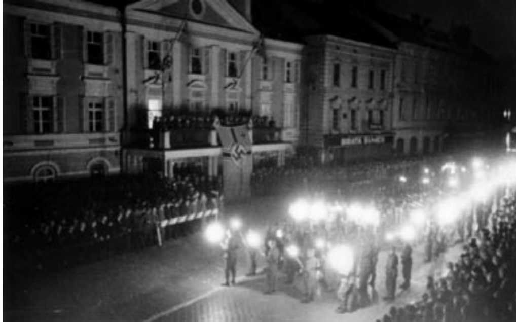
OKUPACIJSKA SLOVESNOST IN BAKLADA PRED MAGISTRATOM, 12. 4. 1941.