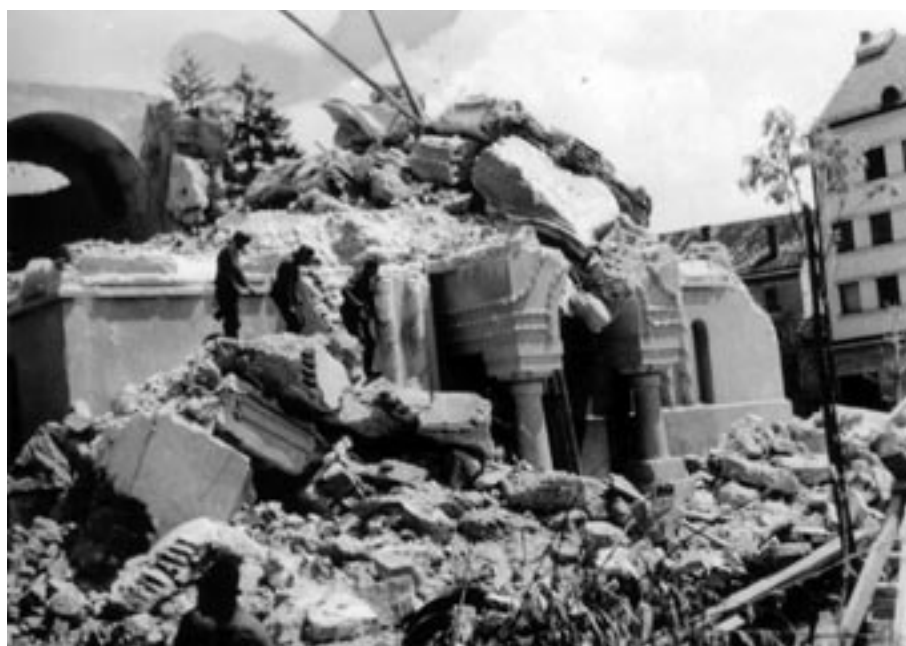
NEMŠKI OKUPATOR SE JE ŽE APRILA 1941 ZNESEL NAD CELJSKO PRAVOSLAVNO CERKVIJO - ZANJ NESPREJEMLJIVIM SIMBOLOM MINULE DRŽAVNE PRIPADNOSTI ŠTAJERSKE. (PERŠAK, OKC)