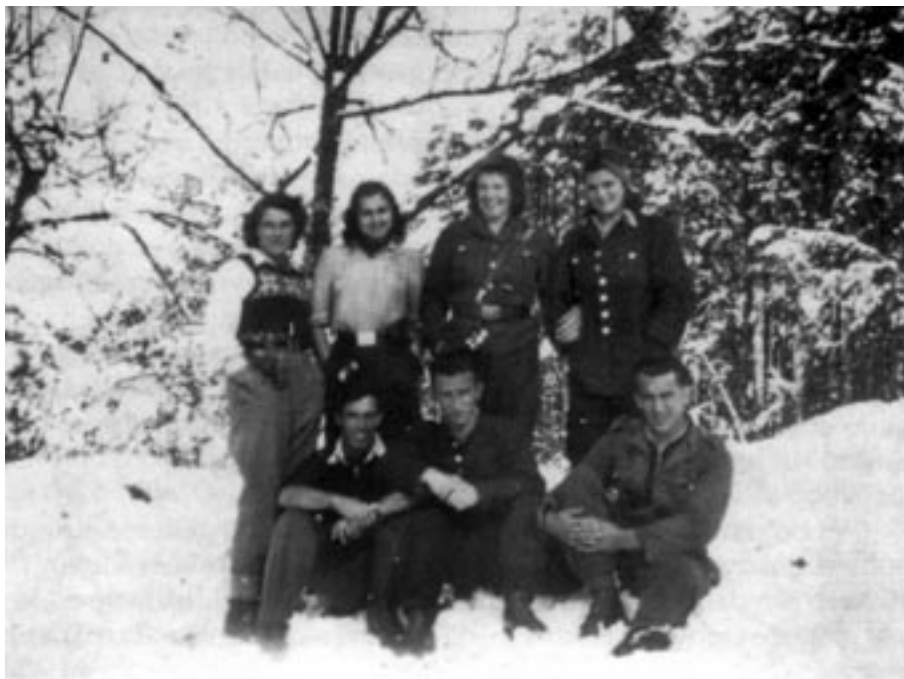
CELJSKI PARTIZANSKI AKTIVISTI, 1944/45. (MNZC)