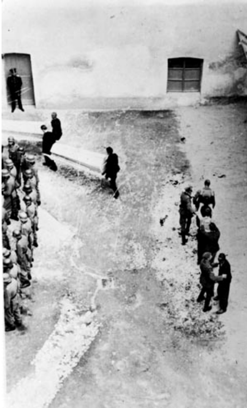
ŠTRELJANJE TALCEV, 22. 7. 1942.