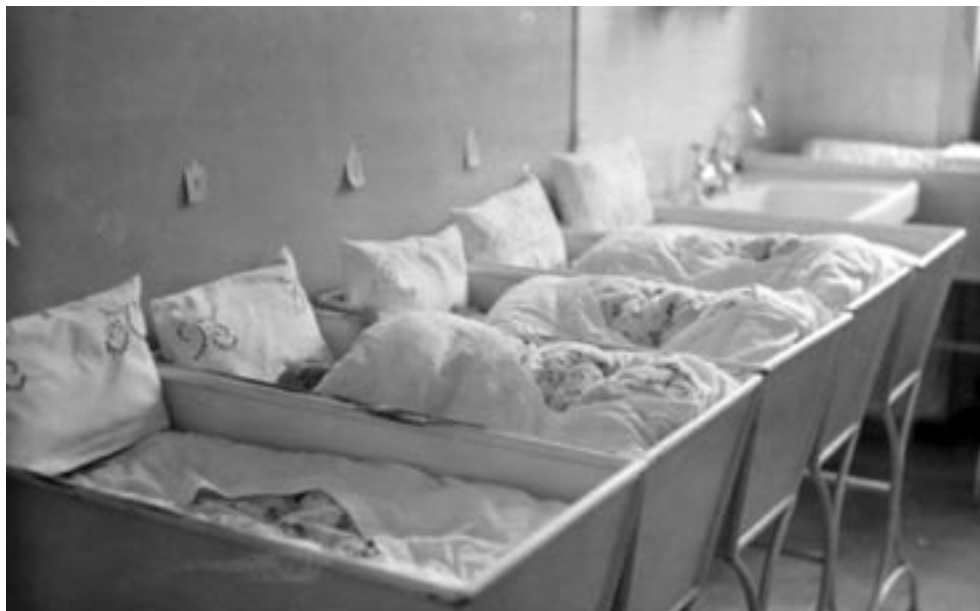
CELJSKA PORODNIŠNICA, 1943. (PERŠAK, OKC)