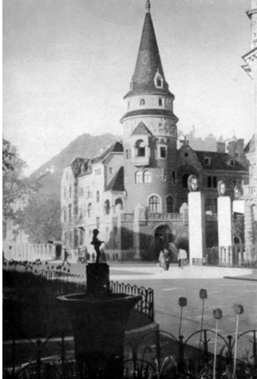
NEMŠKA HIŠA- SIMBOL CELJSKEGA NEMŠTVA. (OKC)