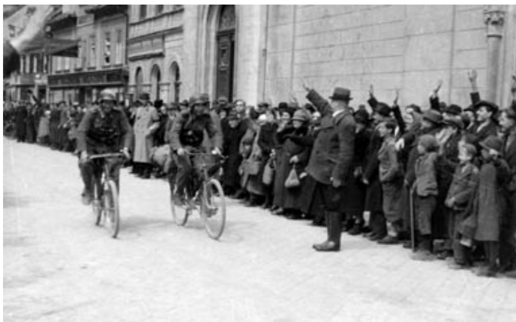
PRIHOD IN »SPONTANI« SPREJEM NEMŠKE VOJSKE, II. 4. 1941. (PELIKAN, MNZC)