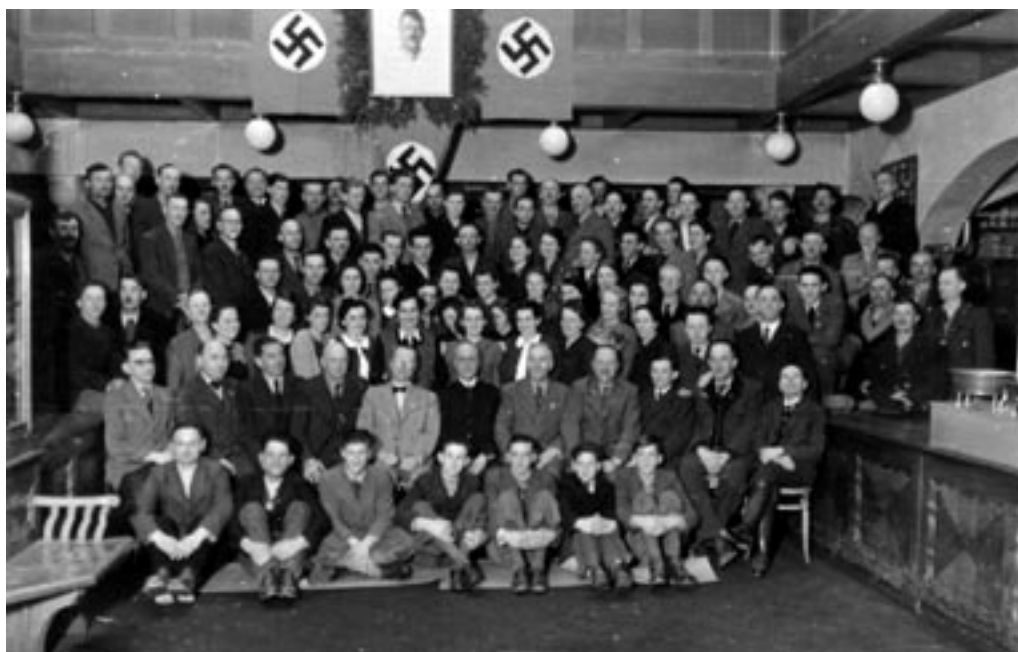
POLITIČNO ZBOROVANJE V TRGOVINI RAKUSCH, 1941. (PERŠAK, OKC)