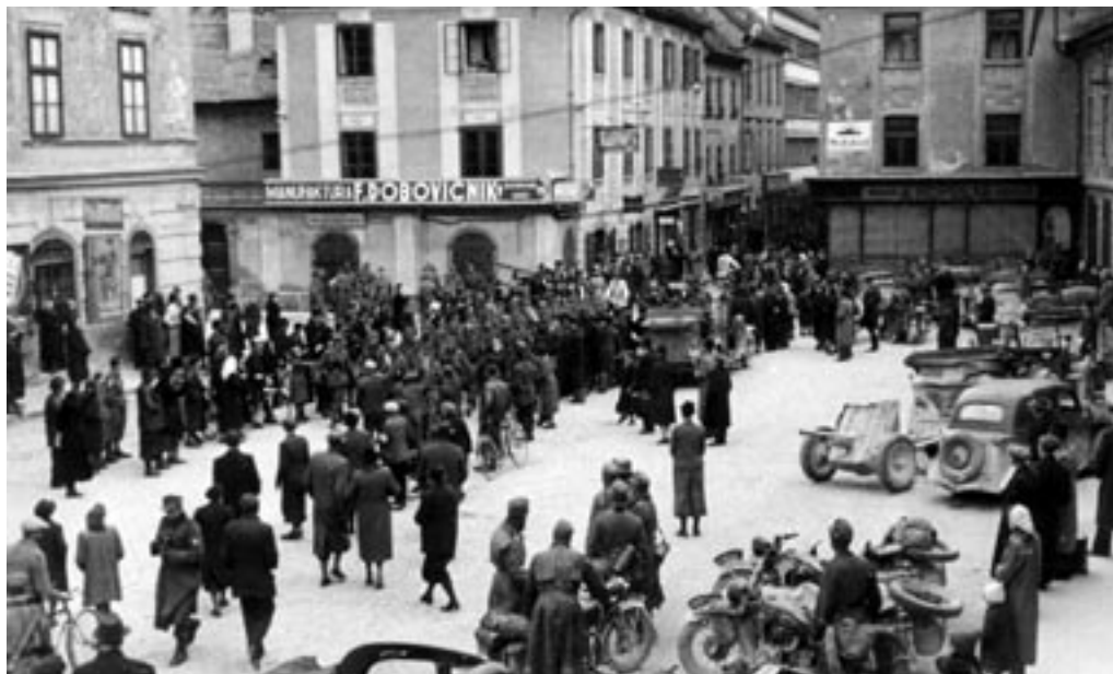
PRIHOD IN »SPONTANI« SPREJEM NEMŠKE VOJSKE, II. 4. 1941. (PELIKAN, MNZC)