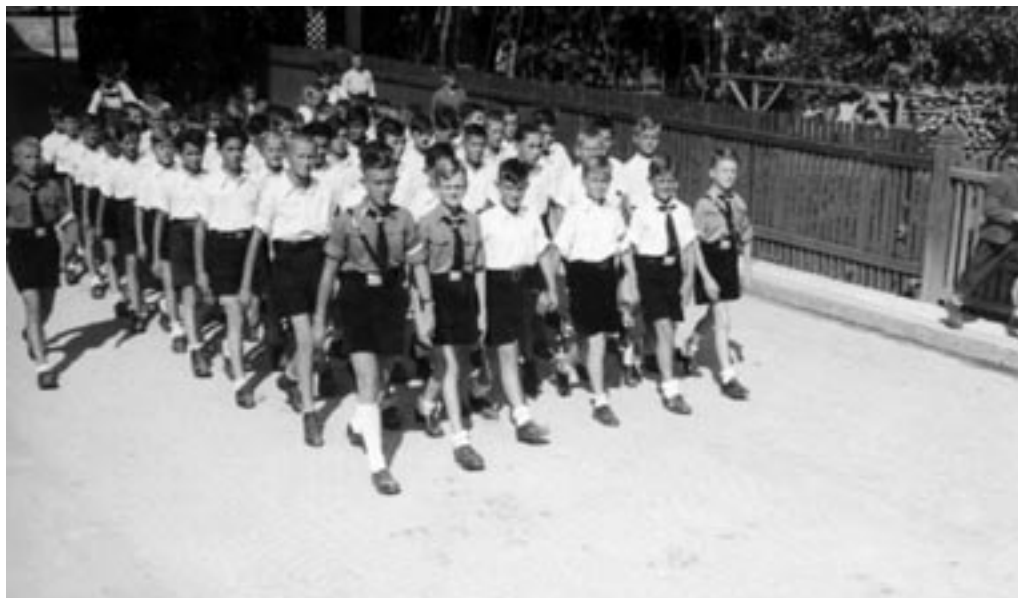
NEMŠKA MLADINA PARADIRA PO CELJSKIH ULICAH, 1941.