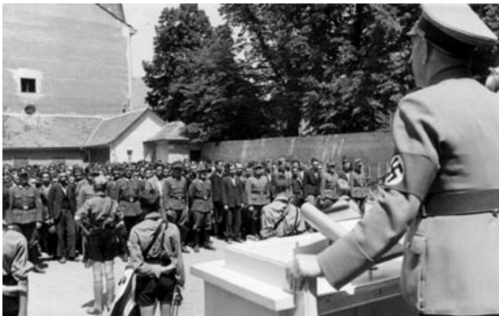
ZBOR NABORNIKOV V MESTNI KASARNI, 23. 7. 1943.