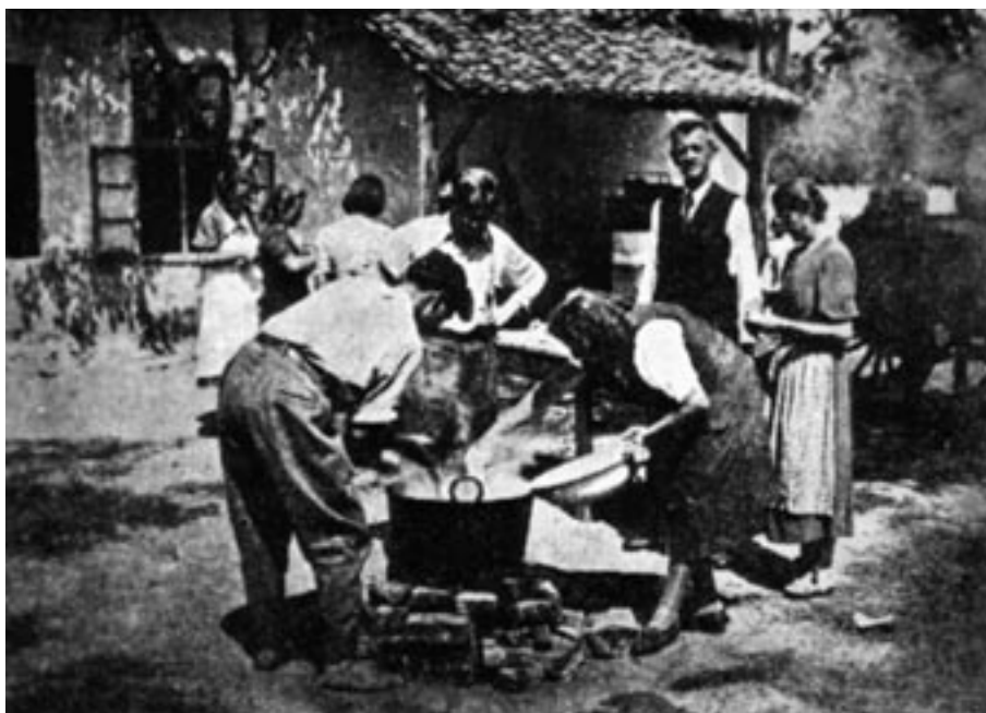
SLOVENSKI IZSELJENCI V ZAJEČARU, 25.9.1941.