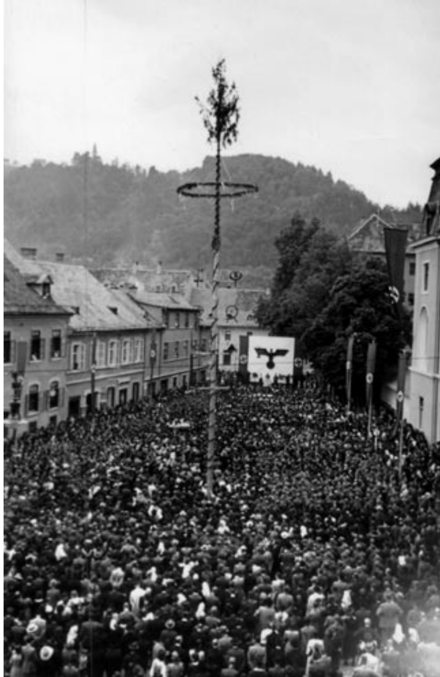
PRVOMAJSKO ZBOROVANJE, 1942. (PELIKAN, MNZC)