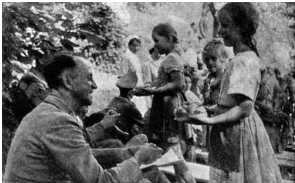
ÜBERREITHER MED OTROKI NA STAREM GRADU, 1944. (PELIKAN, UNTERSTEIRISCHER KALENDER 1944)