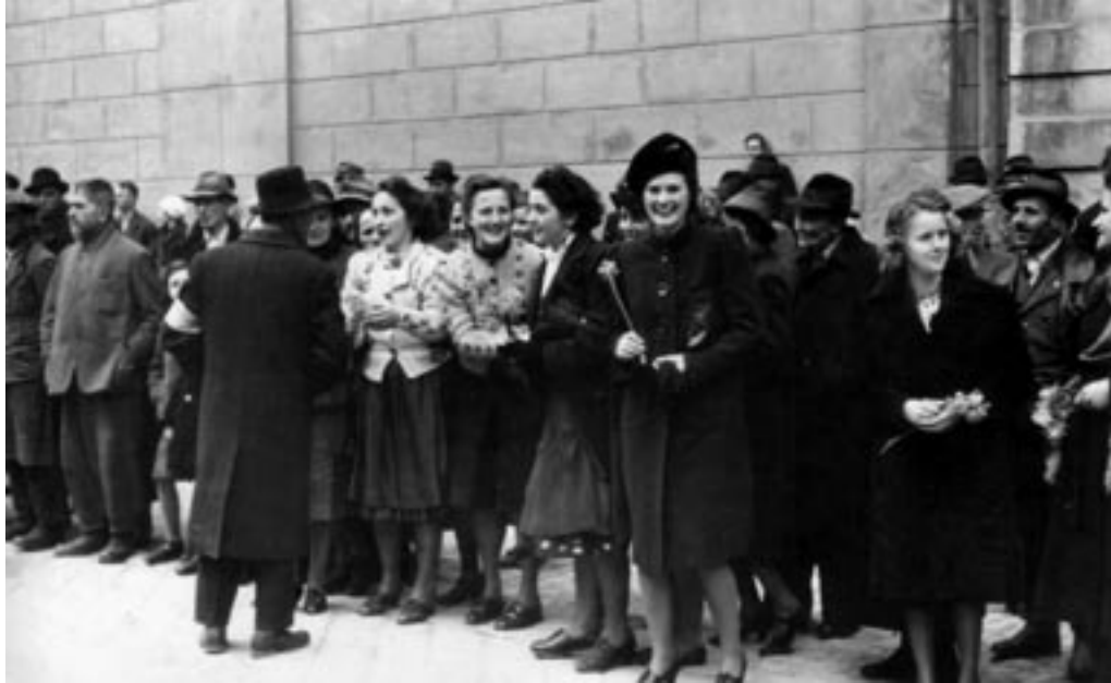
PRIHOD IN »SPONTANI« SPREJEM NEMŠKE VOJSKE, II. 4. 1941. (PERISSICH, MNZC)