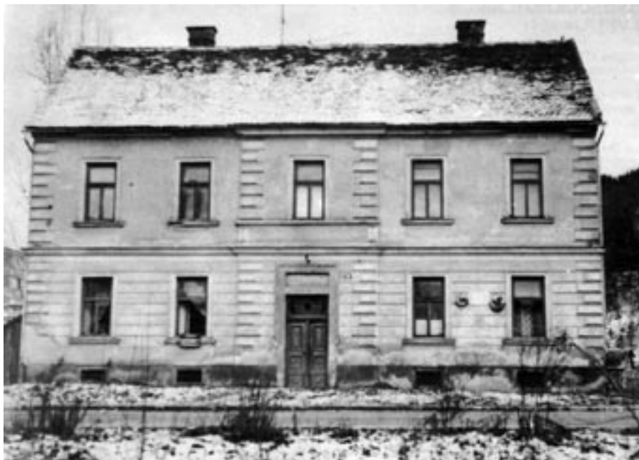
RAKUNOVA HIŠA NA LJUBLJANSKI CESTI V CELJU, KJER JE BIL 6. 7. 1941 USTANOVLJEN MESTNI ODBOR OSVOBODILNE FRONTE.