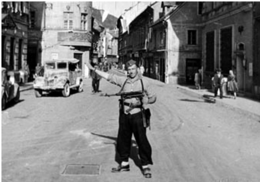
PRIPADNIKI NARODNE ZAŠČITE IN PRVI PARTIZANI VARUJEJO MESTO TER USMERJAJO UMIK SOVRAŽNIKA, MAJ 1945.