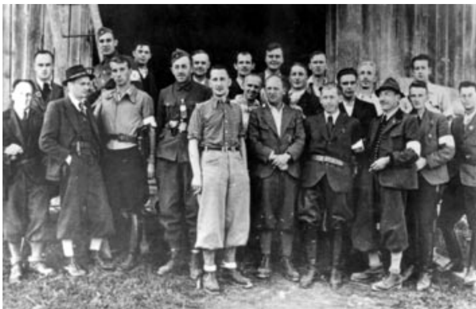
OBOROŽENI CELJSKI KULTURBUNDOVCI IN GESTAPOVCI, 1941. (MNZC)