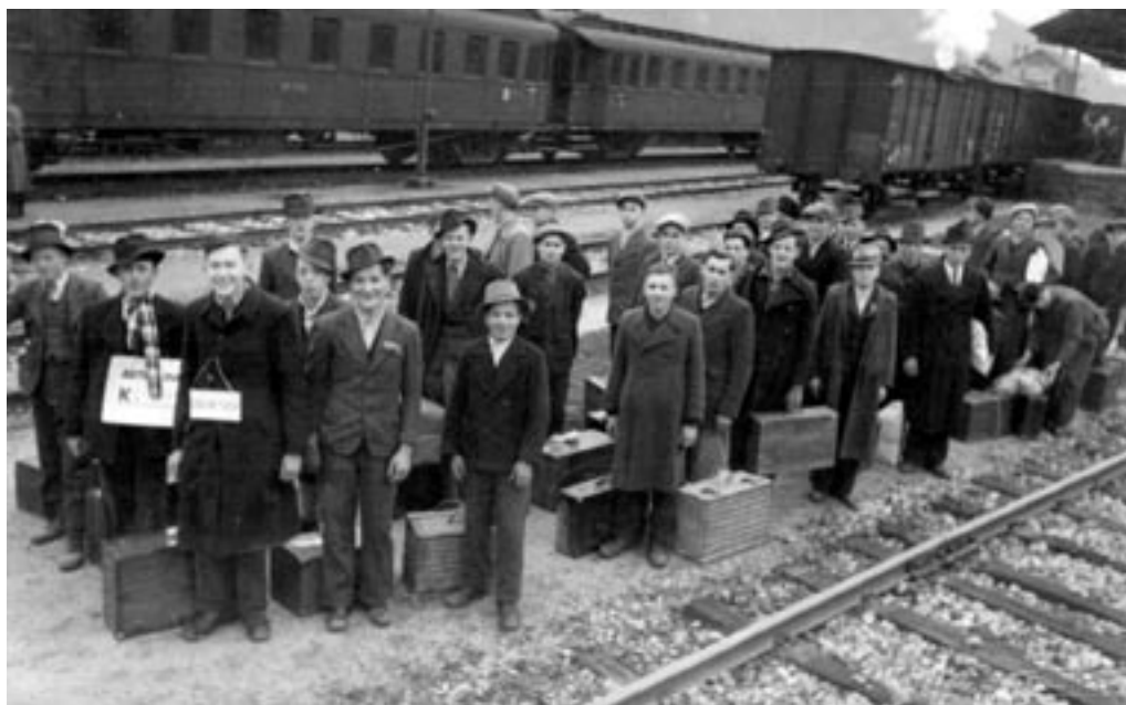
OBVEZNIKI DRŽAVNE DELOVNE SLUŽBE PRED VKRANJEM NA VLAČ, FEBRUAR 1943.