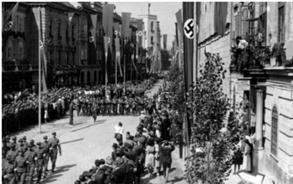
OKROŽNI DAN, 29., 30. 8. 1942.