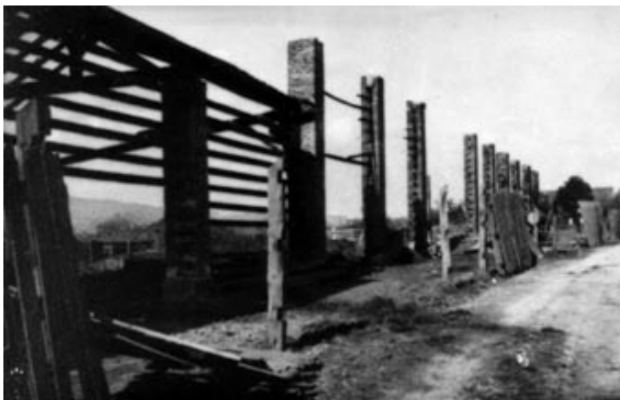
V AKCIJI CELJSKE ČETE POŽGANO GOSPODARSKO POSLOPJE NA VELEPOSESTVU BEŽIGRAD V BUKOVŽLAKU, AVGUST 1941. (MNZC)