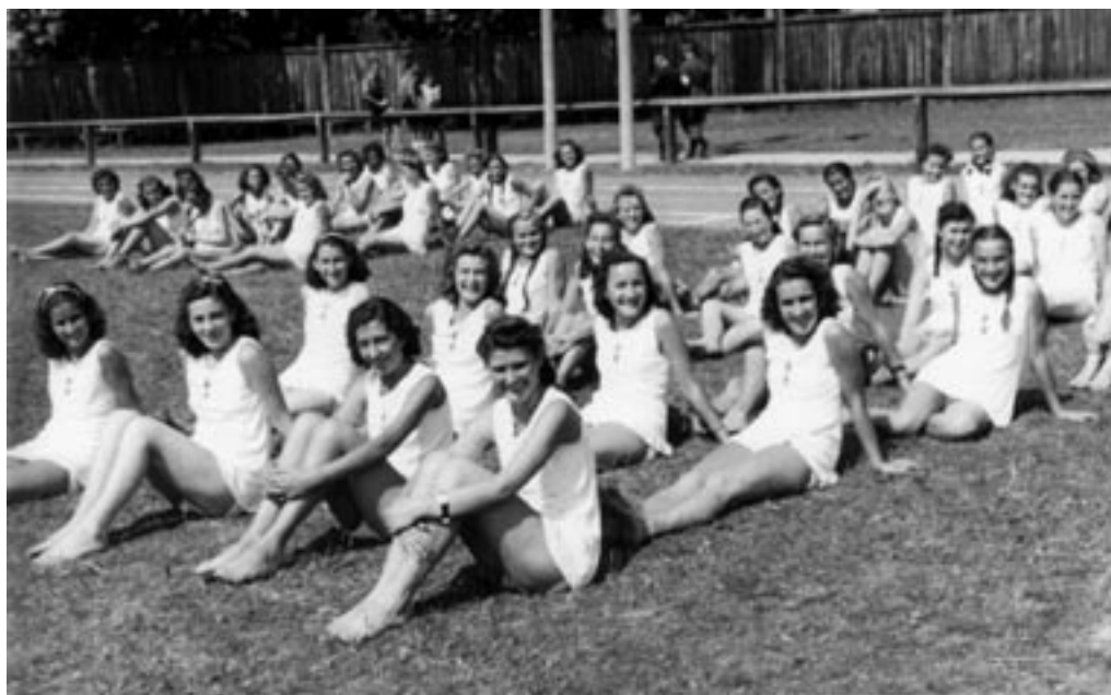
NASTOP STAREJŠIH ČLANIC NEMŠKE MLADINE NA OKROŽNEM DNEVU, 29., 30. 8. 1942.