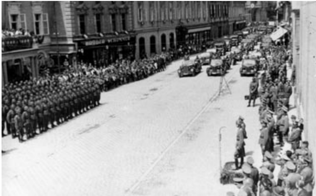
ORGANIZIRANA DOBRODOŠLICA NEMŠKI PROTITANKOVSKI ENOTI NA NJENI POTI SKOZI CELJE, 18. 6. 1941.