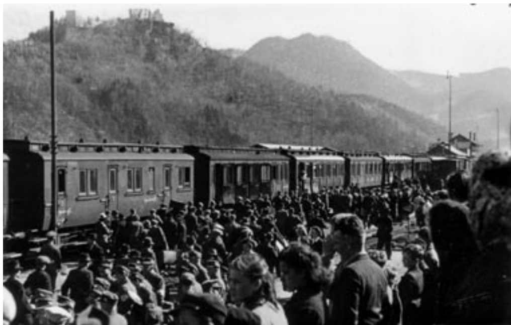
ODHOD MOŠKIH V DRŽAVNO DELOVNO SLUŽBO IN NEMŠKO VOJSKO, 23. 7. 1942.