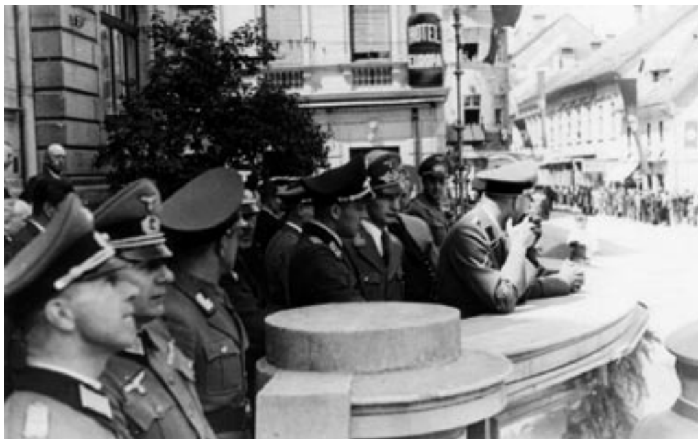
ORGANIZIRANA DOBRODOŠLICA V PRIČAKOVANJU NEMŠKE PROTITANKOVSKKE ENOTE NA NJENI POTI SKOZI CELJE, 18. 6. 1941.