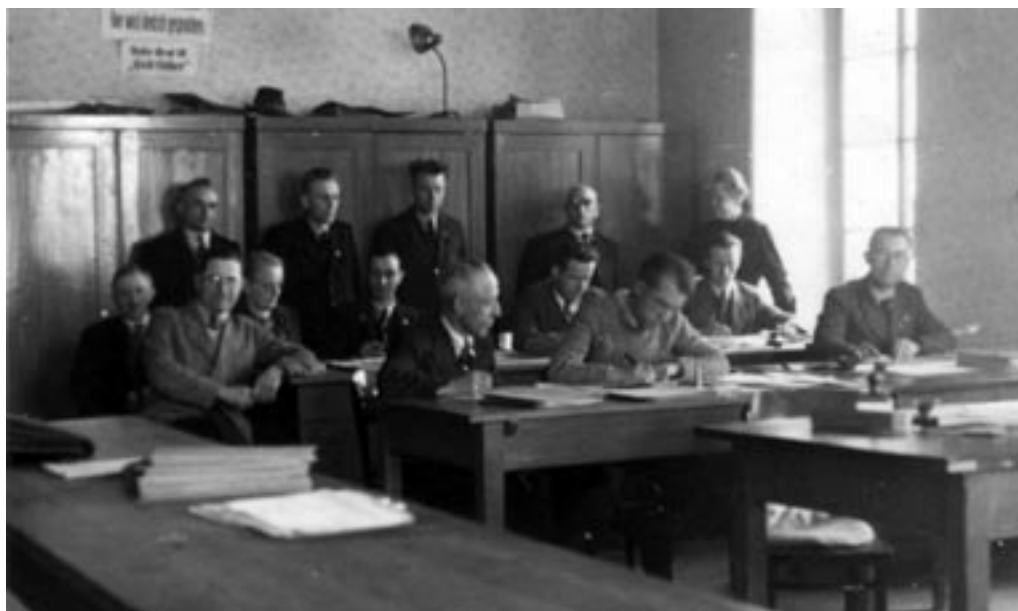
USLUŽBENCI CELJSKE FINANČNE UPRAVE, 15. 5. 1944.