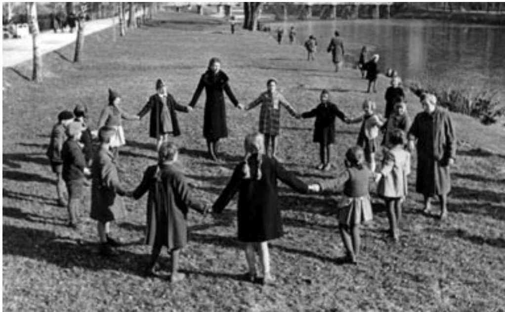
OTROŠKA SKUPINA V MESTNEM PARKU, 1943. (PELIKAN, MNZC)