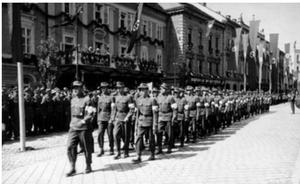
VERMANI NA OKROŽNEM DNEVU, 29., 30. 8. 1942.