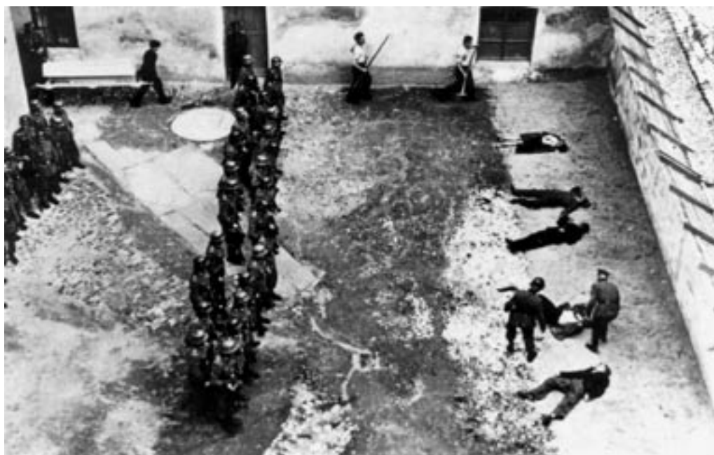
STRELJANJE TALCEV, 22. 7. 1942.