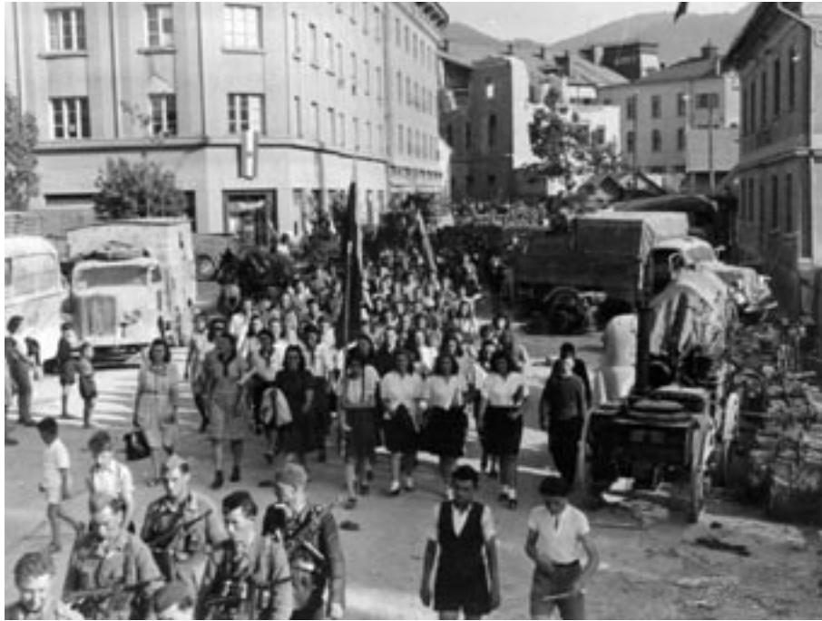
CELJE JE SVOBODNO- PARTIZANSKE ENOTE IN MLADINA NA CELJSKIH ULICAH, 13.5. 1945.